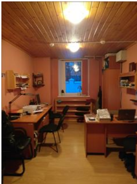
Открытие Единого руководящего Центра сетью мотивационных кабинетов Создан и оснащен Единый руководящий Центр сетью мотивационных кабинетов Калужской области.