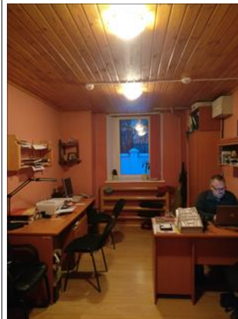
Функционирование Единого руководящего Центра сетью мотивационных кабинетов Калужской области Единый центр управления сетью кабинетов позволяет быстро и слаженно реагировать на сложности и проблемы, возникающие в других населенных пунктах, в которых открыты мотивационные кабинеты, способствует увеличению количества реабилитируемых, а так же улучшению качества услуг.