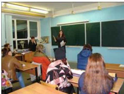
МОУ "СОШ №1 г. Обнинска" 19.10.2017 г. Встреча с родителями учащихся на родительском собрании средней общеобразовательной школы № 1 г. Обнинска.