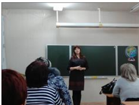
МОУ "СОШ №1 г. Боровска" Профилактическая беседа на тему употребления наркотических средств и алкогольных напитков в средней школе №1 г. Боровска