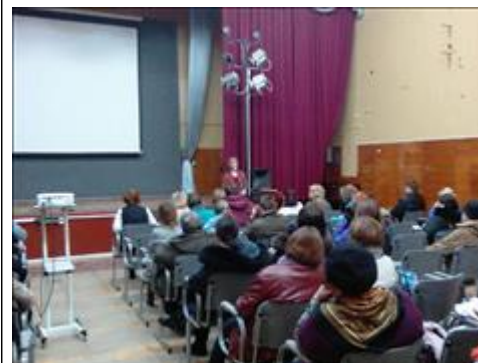
МОУ "Гимназия №2" г. Обнинск Сотрудники АНО ОЦП "Спас" проводят лекцию в Гимназии г. Обнинска