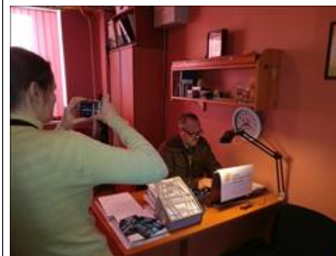
Открытие Единого руководящего центра управления сетью кабинетов профилактики и мотивации На фото представители СМИ и общественных организаций