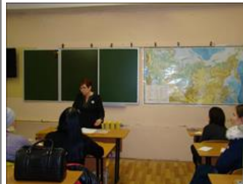
МОУ "СОШ №2 г. Балабаново-1" Лекция на родительском собрании в школе № 1 г. Балабаново-1