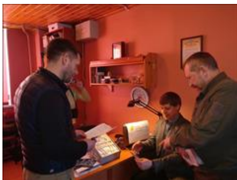
Открытие Единого руководящего центра управления сетью кабинетов профилактики и мотивации На фото член Общественной палаты Калужской области