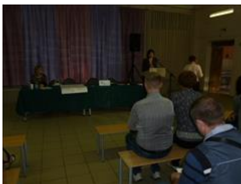
Посещение 7 школы Встреча с целевыми группами