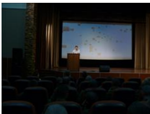
Посещение в/ч 3694 г. Балабаново Встреча с целевыми группами