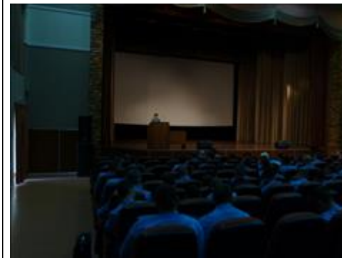
Посещение в/ч 3694 г. Балабаново Встреча с целевыми группами