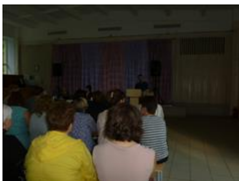
Посещение 7 школы г. Обнинска Встреча с целевыми группами