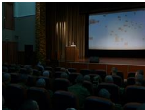
Посещение в/ч 3694 г. Балабаново Встреча с целевыми группами