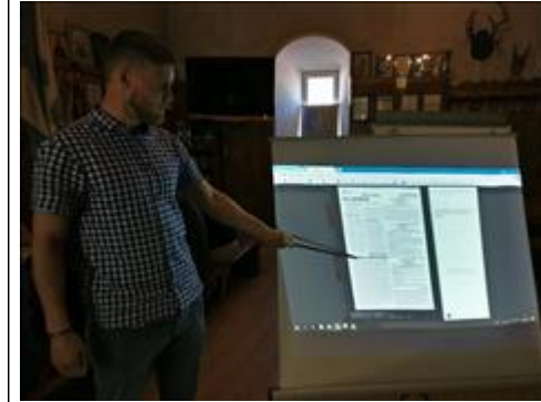
Круглый стол "Презентация модели сети кабинетов профилактики и мотивации Презентация на Круглом столе