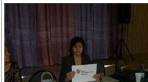
Посещение 7 школы г.Обнинска Встречи с целевыми группами