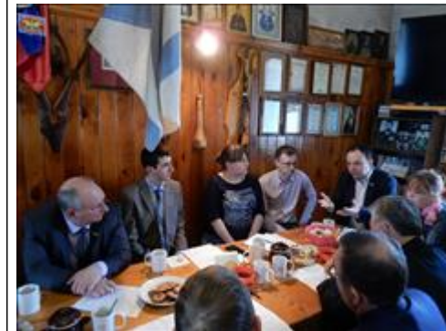
Круглый стол "Презентация модели сети кабинетов профилактики и мотивации Кофе-брейк "Круглого стола"