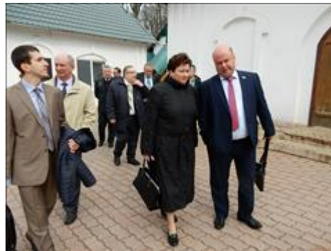
Круглый стол "Презентация модели сети кабинетов профилактики и мотивации Экскурсия по центру гостей Круглого стола