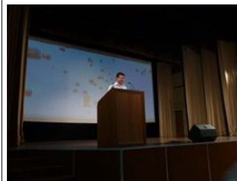
Посещение в/ч 3694 г. Балабаново Встреча с целевыми группами