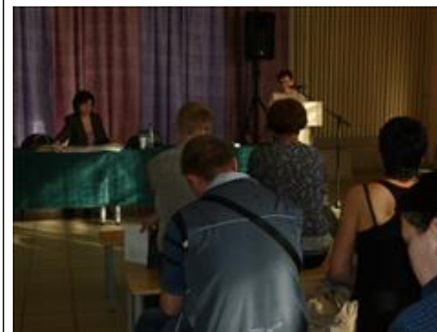
Посещение 7 школы г.Обнинска Встреча с целевыми группами