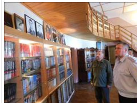
Круглый стол "Презентация модели сети кабинетов профилактики и мотивации" Начальник ОМВД России по г. Обнинску Сергей Воронежский на экскурсии по центру, перед началом "круглого стола"

Электронные версии материалов (бюллетеней, брошюр, буклетов, газет, докладов, журналов, книг, презентаций, сборников и иных), созданных с использованием гранта в отчетном периоде (при условии, что такие материалы не содержатся в материалах, указанных в подпункте 5 настоящего пункта)