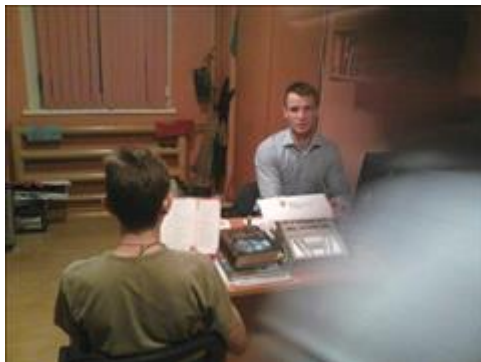
Кабинет профилактики и мотивации Прием в кабинете профилактики и мотивации