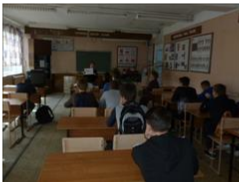
Посещение 7 школы г. Обнинска Встречи с целевыми группами

Информация, указанная Вами в данном поле отчета, будет доступна для посетителей сайта Фонда президентских грантов (в том числе представителей СМИ)