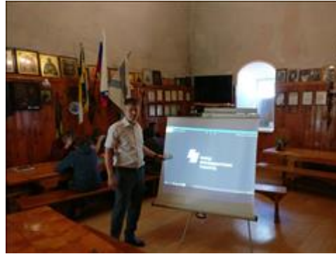
Круглый стол "Презентация модели сети кабинетов профилактики и мотивации как средства оптимизации фу Подготовка к Презентации

Мероприятие: Круглый стол "Презентация модели сети кабинетов профилактики и мотивации как средства оптимизации функционирования региональной системы профилактики правонарушений, медико-социальной реабилитации и ресоциализации лиц, осуществляющих незаконное потребление наркотических средств и психотропных веществ"