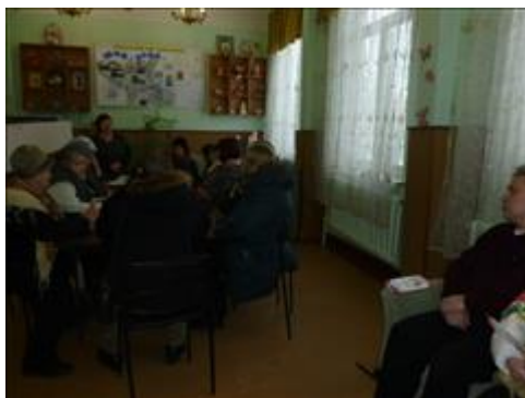
Проведение беседы с родителями и педагогическим составом школы-интерната Беседа проходила в рамках реализации проекта Президентских грантов