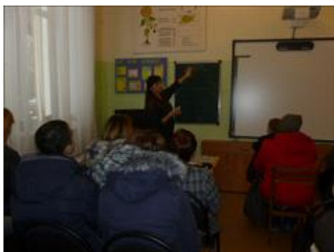
Проведение беседы с родителями Беседа проходила в одной из школ г. Обнинска