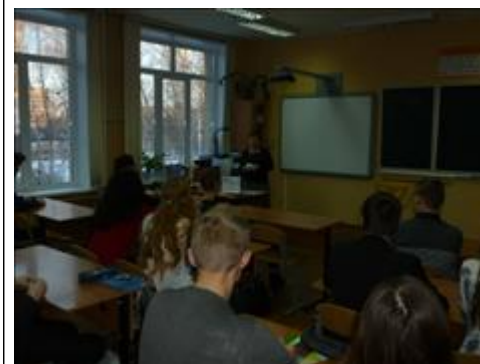
Беседа со школьниками старших классов Беседа проходила в одной из школ г.Обнинска