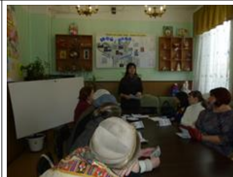
Проведение беседы с родителями в одном из кабинетов Школы "Гармония" в г. Балабаново