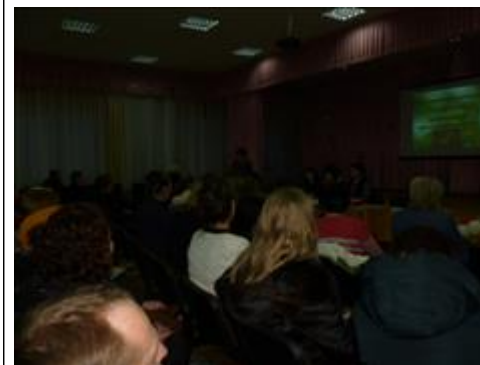
Встреча с родителями и педагогическим составом Проведена лекция-беседа в Военном городке г. Балабаново