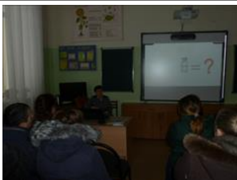
Беседа с родителями Беседа проходила в одной из школ г.Обнинска